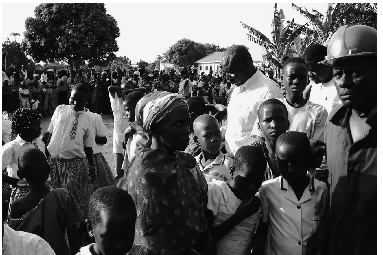
Viel Volk an der Einweihung in Gilgal Primary School

Wir beklagen schlimme politische Zustände in afrikanischen Ländern. Aber haben wir vergessen, dass der ugandische Schreckensdiktator Idi Amin von den Engländern gegen den Sozialisten Julius Nye-