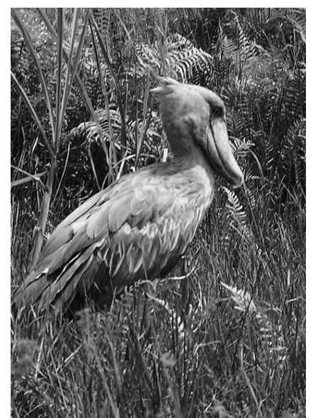
Shoebill im Sumpf des Lake Victoria

unser Anreiz. Wir entdeckten wunderbare Buschlandschaften mit sehr urtümlichen Dörfern. Die Dörfer bestehen aus Rundhütten. Rund um das Dorf befindet sich der Ackerbau. Kühe und Ziegen weiden in der Nähe des Dorfes. Im Gegensatz zur Stadt Kampala sind diese Dörfer im Busch sehr sauber. Plastik und anderer «Zivilisationsabfall» fehlt gänzlich. Das ist sehr wohltuend. In der Nähe des Fischerdorfes Lwampanga werden wir mit Einheimischen handelseinig: Wir kriegen eine Bootsfahrt im Kanu für sieben Schweizer Franken. Dank unserem Fahrer können wir uns mit den Einheimischen über Englisch-Luganda unter-