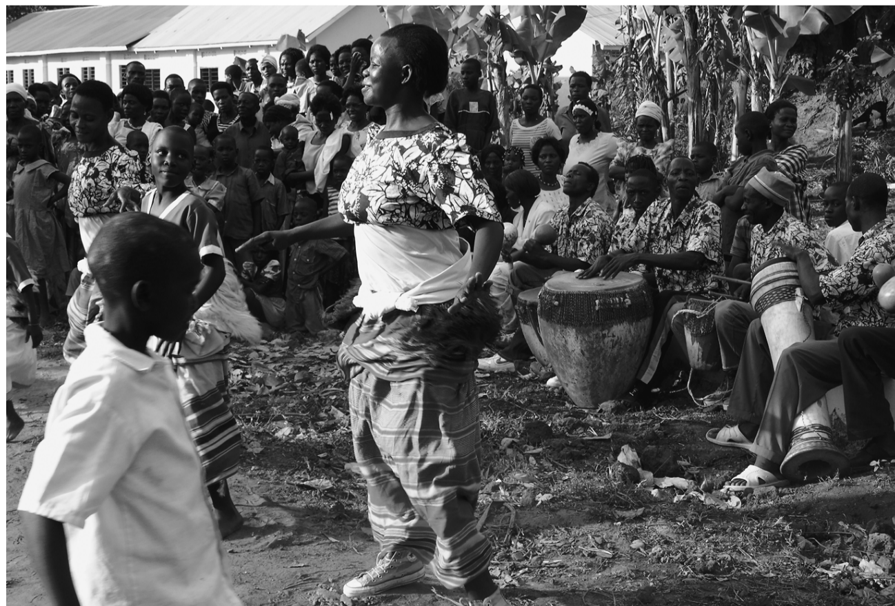
Tanzen und singen unter den Bananenstauden