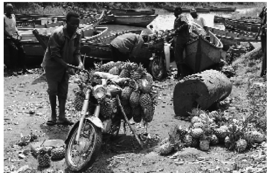
Motorrad wird mit Ananas beladen

500 Menschen, unterstützt von unserem Verein, in der Gilgal Primary School. Der Betrieb (Essen, Löhne für Lehrpersonal und Aufsicht und medizinische Versorgung (151 unserer Kinder sind HIV+ und werden mit retroviralen Mitteln behandelt) kostet uns etwa 4500 Franken pro Monat. Ein Kind leidet an Elephantitis, bei einem muss ein Tumor entfernt werden. Für die Spitalkostendeckung suchen wir Sponsoren.