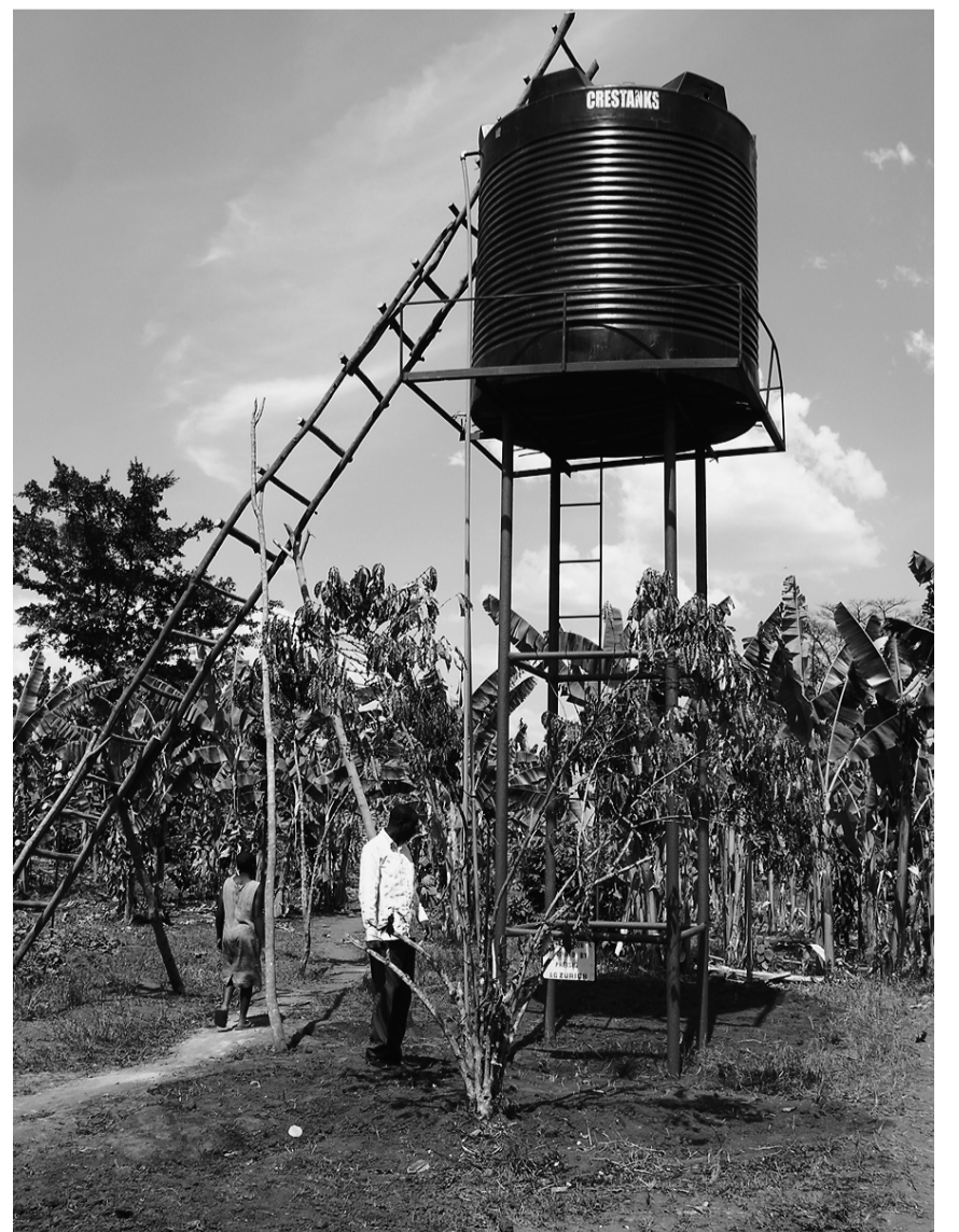
Der neue Wassertank