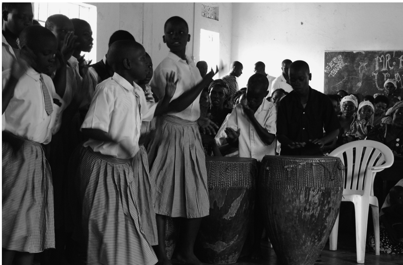
Schülerinnen singen und tanzen