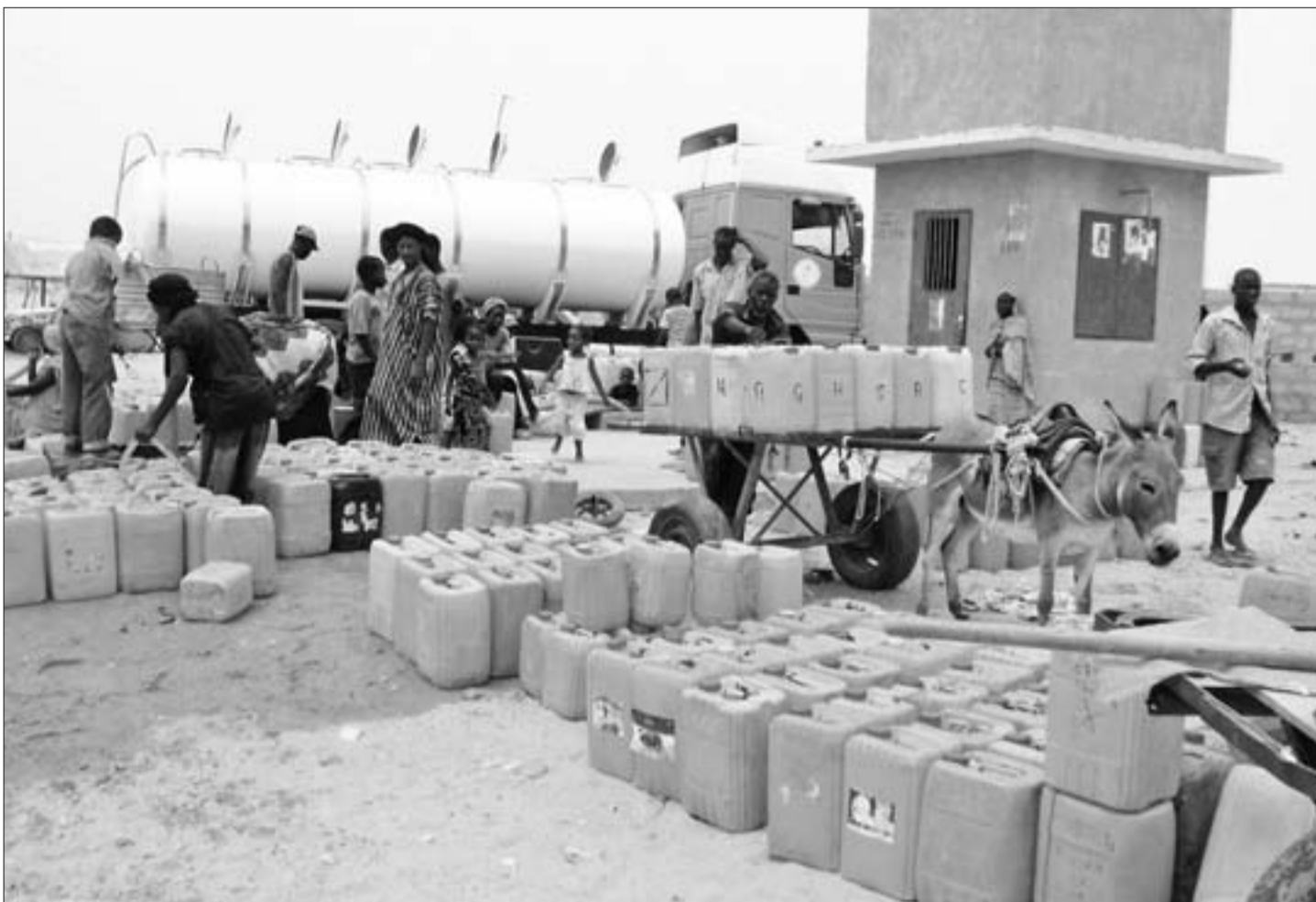
A Nouakchott, capitale de la Mauritanie, l'un des deux camions-citernes du projet en train de ravitailler un point d'eau.